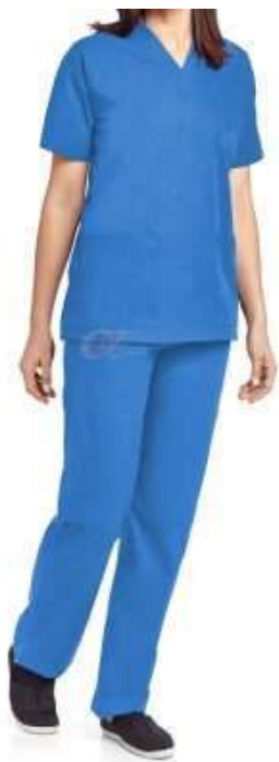
TABELA DE MEDIDAS